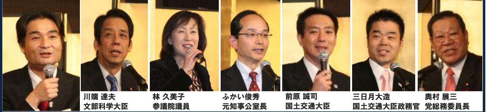
川端 達夫 文部科学大臣